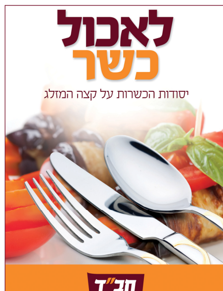
העם דורש מזון כשר. חוברת כשרות של צעירי חב"ד

הצביעות הגדולה: ביד אחת בעלי העסקים גורפים את רווחיה של תעודת הכשרות, ובשנייה הם מטילים בוץ בגוף שמביא להם את הלקוחות