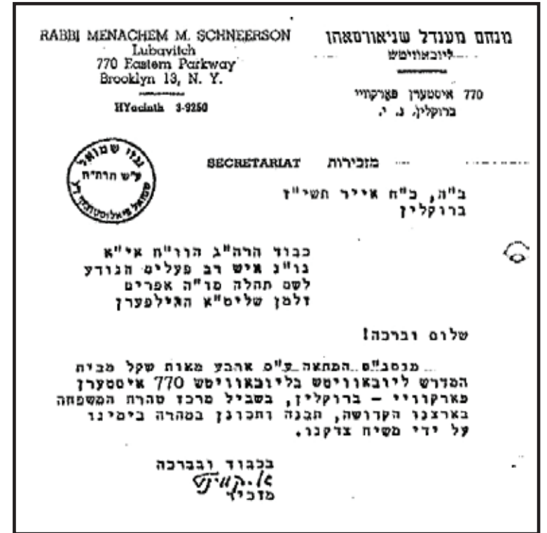
מכתב מזכירות הרבי שצורף להמחאה ע"ס 400 שקל - דמי ה'מגבית' שנאספה

"וזכות מצוה גדולה זו תכן עליכם להתברך ממקור הברכות בשפע ברכה והצלחה בכל מעשה ידיכם. ותזכו להוסיף חיל בפעולותיכם החשובות בכלל ובפרט להפיץ המעינות חוצה להגדיל תורה ולהאדירה, ויה"ר שנזכה במהרה לראות בהרמת